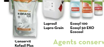
Conservit Kofasil Plus